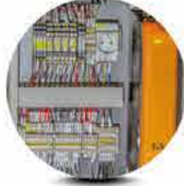
Alman Teknolojisi Robotik Kontrol Sistemleri