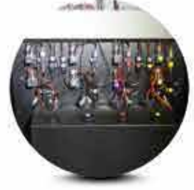
Boya Tipi Süblimasyon Pigment