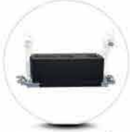
Endüstriyel Baskı Kafaları 5 Pikolitre Ayarlanabilir Damla Hacmi